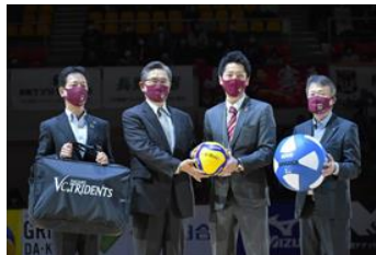
2020年11月29日強化備品贈呈式